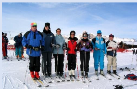
Vor dem Start auf die Piste