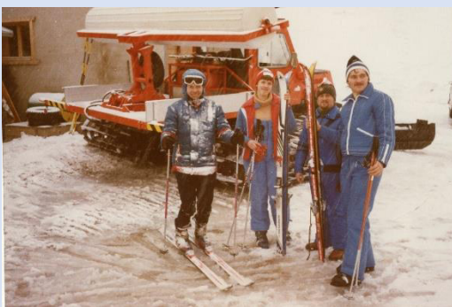
Nach der letzten Abfahrt