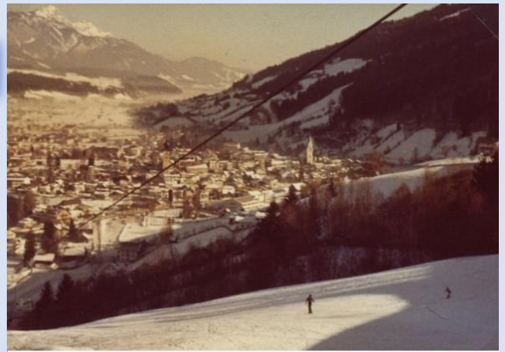
Blick auf Schladming vom Starchlhof