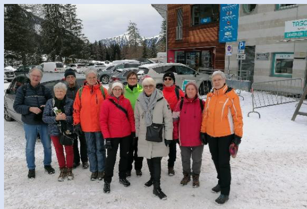
Die Wandergruppe in Antholz