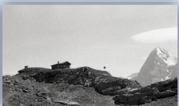
Unser Quartier: Die Schilthornhütte (bei Vortour im Sommer) mit Eiger-Nordwand