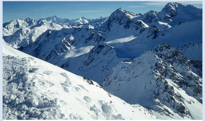
Die Region der 3000-er

Erheblich kleiner als in den Jahren zuvor war die Gruppe, die sich auf den Weg zu den schweizerischen 3000-ern im Skigebiet der 4 vallées machte. Vom Quartier in Nendaz auf 1400 m erschlossen Lifts und Seilbahnen die Skigebiete bis in Höhen über 3000 m.