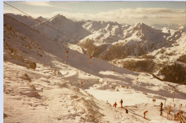
Auf der Piste mit Blick auf 3000-er