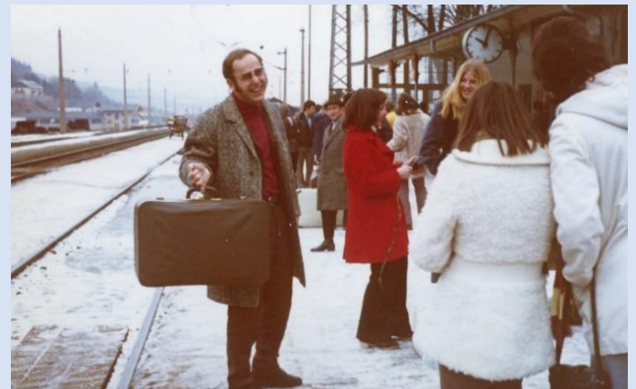
Am Bahnhof von Schladming vor der Heimreise