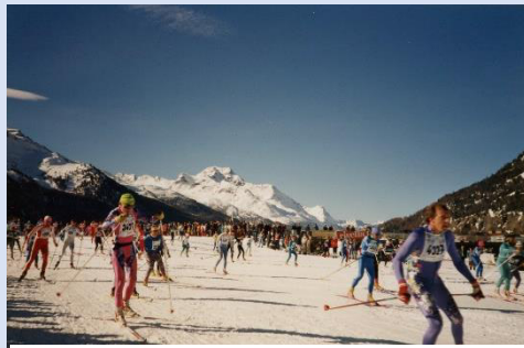
Langlaufmeisterschaften in St. Moritz