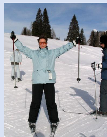
„Schifoan is des leiwaundste“