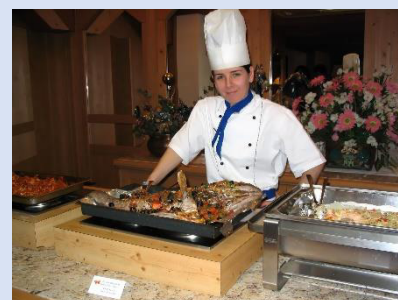
Vom Küchenpersonal serviert