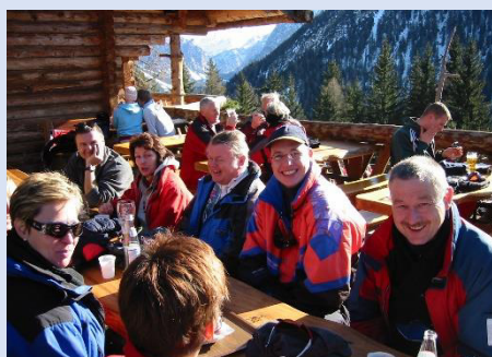
Mittagsrast auf der Hütte