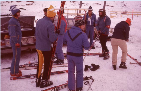
Lagebesprechung vor dem Pistenstart