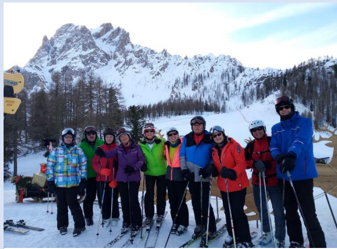
Ausflug nach Sexten