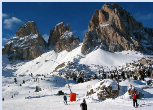
Corvara gehörte auch zum Wochenprogramm