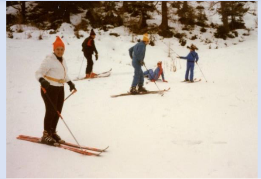
Auf dem Weg zur Piste