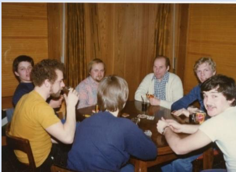
In froher Runde beim abendlichen Après-Ski