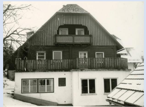
Das Quartier: Der Starchlhof