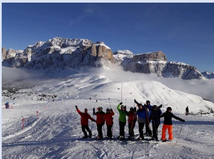
Unterwegs auf der sella ronda