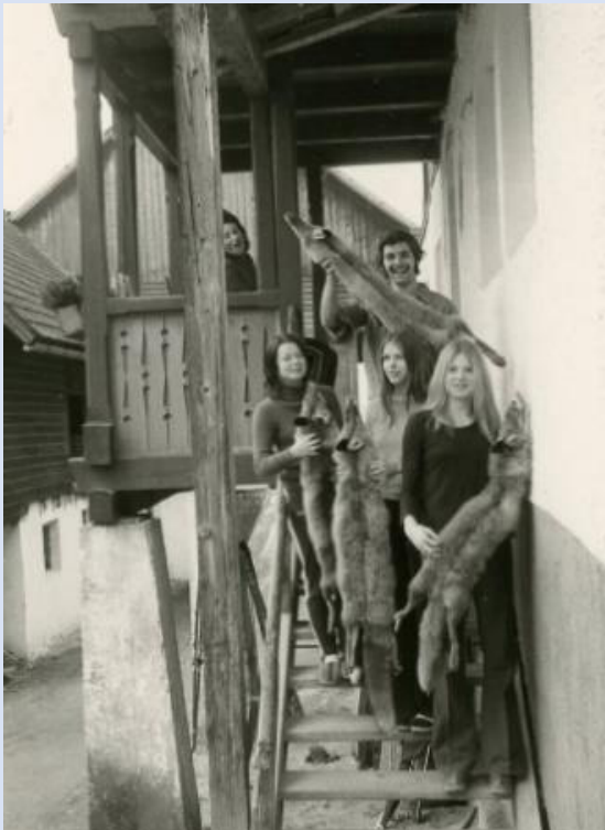
Mit Trophäen von der Fuchsjagd