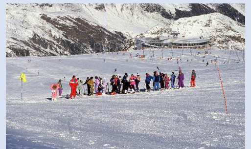
1989 Auf dem Stubaier Gletscher