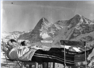
Entspannung vor der Eiger-Nordwand