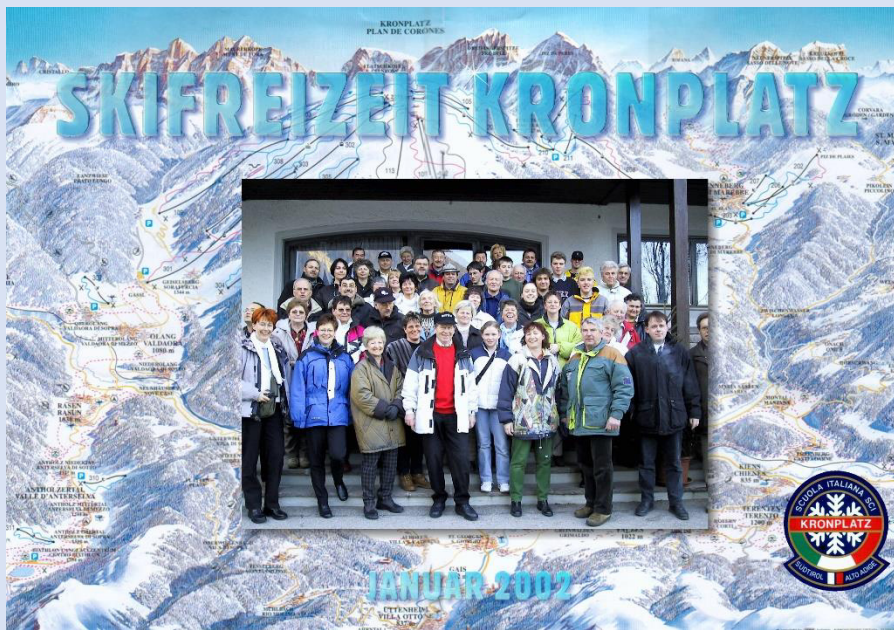
Gruppenbild vor dem Hotel

2000 war der Kronplatz in Südtirol erstmals Ziel der TV-Skiausfahrten. Mit dem Hotel Windschar in Gais konnte ein Quartier gefunden werden, das in Ausstattung und Kulinarik eine komfortable Ergänzung zum Pistenparadies am Kronplatz darstellte. Die Zufriedenheit mit Skigebiet und Hotel machte den Kronplatz zum Dauerziel der künftigen Skiausfahrten.