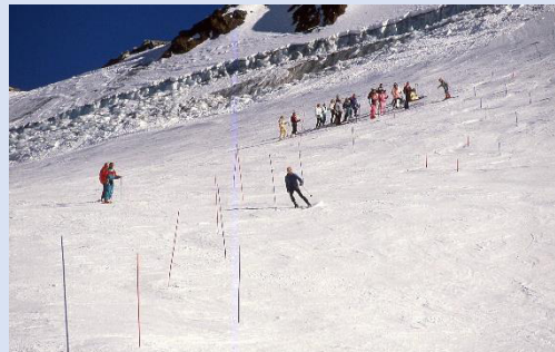
1988 Slalomtraining in Sölden