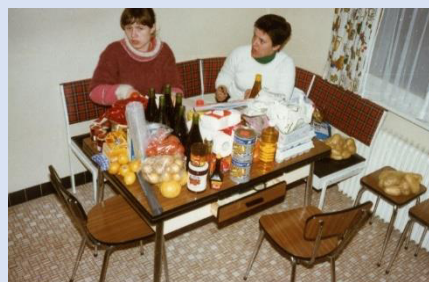
Vorbereitungen für das Abendessen