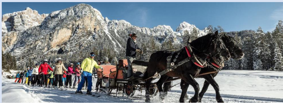
Mit dem besonderen Skilift nach Armentarola