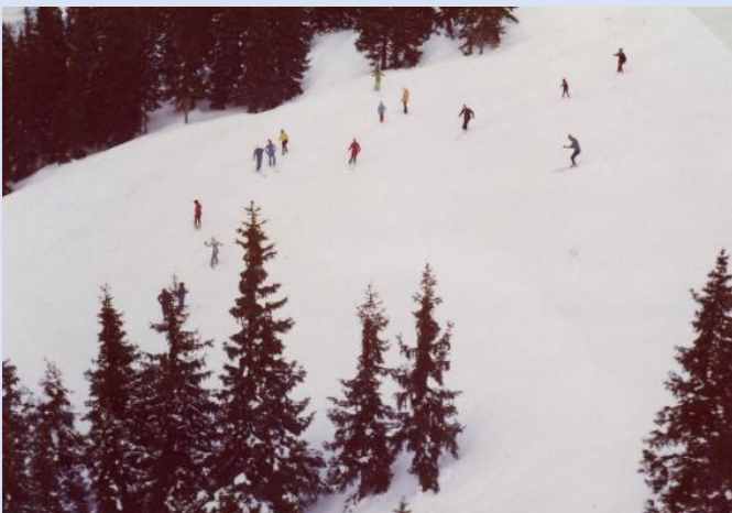
Auf dem Zielhang der Planaiabfahrt nach Schladming