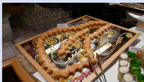
Ein Eindruck vom Nachspeisenbuffet