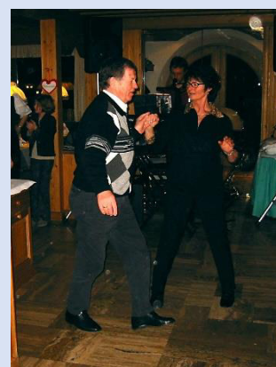
Tanzabend im Hotel